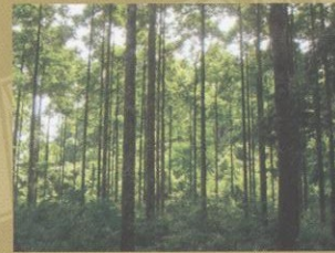
■ Một góc Vườn quốc gia Cúc Phương A view of Cuc Phuong National Park.

Mạng lưới các cơ quan thực thi pháp luật về quản lý động vật, thực vật hoang dã (VIETNAM - WEN) với Ban chỉ đạo liên ngành được Bộ trưởng Bộ Nông nghiệp và Phát triển nông thôn thành lập tại Quyết định số 2200/QĐ-BNN-TCCB ngày 17/8/2010. Ban chỉ đạo do Thứ trưởng Bộ Nông nghiệp và Phát triển nông thôn làm Trưởng Ban với sự tham gia của lãnh đạo các cơ quan có liên quan gồm Tổng cục Lâm nghiệp, Cục Kiểm lâm và Cơ quan Quản lý CITES Việt Nam - Bộ Nông nghiệp và Phát triển nông thôn, Cục Bảo tồn đa dạng sinh học - Bộ Tài nguyên và Môi trường, Cục Quản lý thị trường - Bộ Công thương, Cục Điều tra chống buôn lậu Hải quan - Bộ Tài chính, Cục Cảnh sát môi trường và Cục An ninh Nông nghiệp nông thôn - Bộ Công an, Cục Phòng chống tội phạm ma túy Bộ đội biên phòng - Bộ Quốc phòng. Viet Nam - WEN sẽ tăng cường sự phối hợp giữa các cơ quan chức năng có liên quan để triển khai những hoạt động thực thi pháp luật ngăn chặn các hành vi vi phạm về chế độ quản lý động vật, thực vật hoang dã trong nước và qua biên giới Việt Nam.