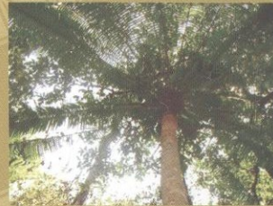
■ Thiên tuế - Cycadaceae

Việt Nam có tính đa dạng sinh học giàu có và độc đáo, với nhiều loài động vật đặc hữu - là một phần quan trọng của di sản sinh thái trong toàn khu vực Đông Nam Á. Tuy nhiên, nguồn tài nguyên thiên nhiên của Việt Nam cũng đang bị đe dọa do mất sinh cảnh và nạn buôn bán động vật, thực vật hoang dã trái phép. Ngoài ra, với những lợi thế về giao thông, hoạt động vận chuyển, buôn bán trái phép động vật, thực vật hoang dã bằng đường hàng không, đường bộ và đường biển từ các nơi đến Việt Nam cũng làm cho Việt Nam trở thành nơi quá cảnh của việc buôn bán trái phép xuyên biên giới. Vì vậy, Việt Nam đóng một vai trò hết sức quan trọng trong việc ngăn chặn tội phạm về buôn bán quốc tế động vật, thực vật hoang dã đối với toàn khu vực.