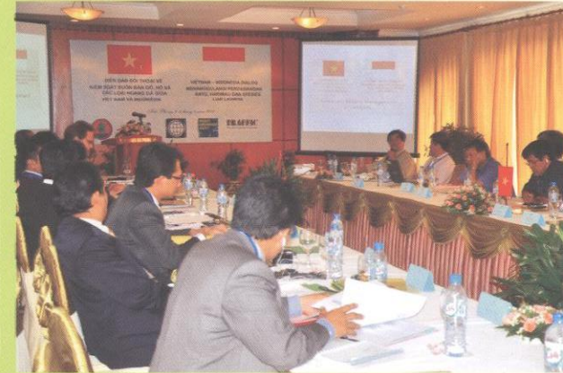
Đối thoại Việt Nam - Inđônêxia nhằm tăng cường hợp tác kiểm soát buôn bán các loài hoang dã - The bilateral meeting between Indonesia and Vietnam on cooperation in wildlife enforcement.

REPORT! Report any suspicious action or wildlife crime to 1800-1522 or 098-666-8333