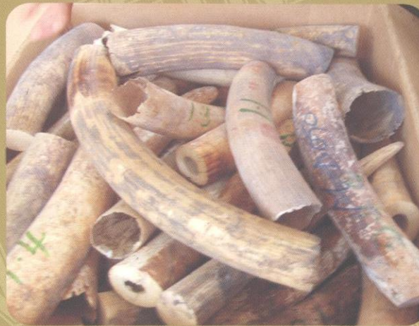
■ Confiscate ivory - Bắt giữ ngà voi

The ASEAN region contains some of the world's richest areas for biodiversity, which are home to many rare wild animals and plants species and are "banks" of biodiversity, contributing to national food production, human health, eco-tourism and a country's economy in general. But Southeast Asia has become a global hotspot for the poaching, trafficking, and consumption of protected wildlife. The scale of the illegal wildlife trade is alarming and affects all Southeast Asian nations. If trends continue, scientists predict up to 40% of Southeast Asia's animal and plant species could be wiped out this century. Unregulated trade in animals is one of the biggest challenges to biodiversity conservation in Southeast Asia.