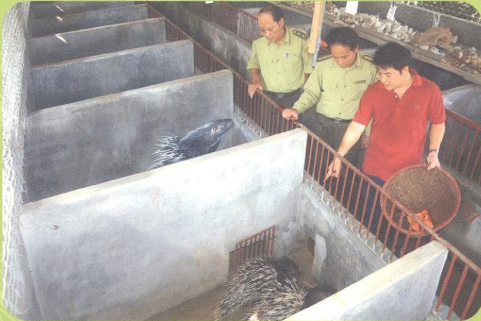
■ Lực lượng Kiểm lâm quản lý các trại nuôi động vật hoang dã Captive breeding farms are managed strictly by Forest Ranger.

The network has developed links to Interpol, World Customs Organization (WCO), the CITES Secretariat, and United Nations Office on Drugs and Crime (UNODC). FREELAND FOUNDATION and TRAFFIC, through a cooperative partnership with US Agency for International Development (USAID), are providing technical assistance to government agencies that are implementing ASEAN-WEN.